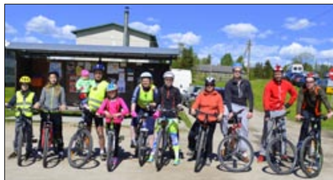
Matkaseltskond alustas sõitu Osula bussijaamast.

Valla toetuse saamiseks pöörduge tööpäevadel valda.