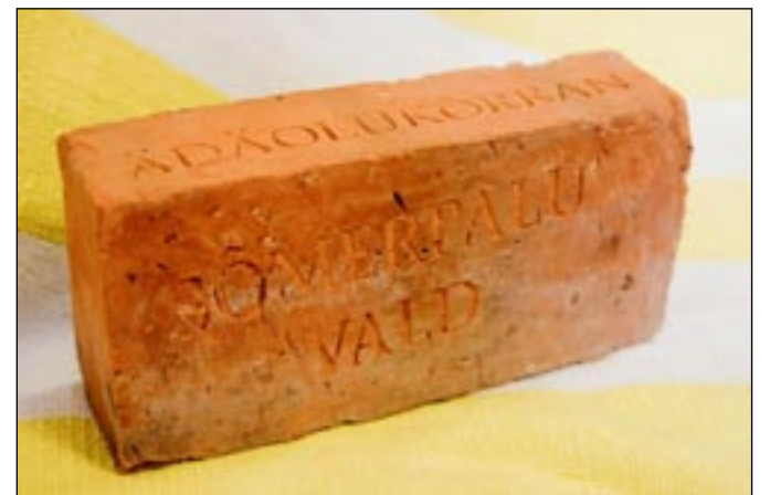
Sõmerpalu valla suveniiri tiitli kopsakaim kandidaat.