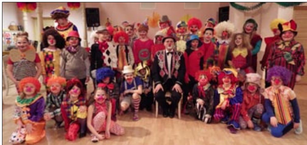
Sõmerpalu kooli karnevalil «Klounide paraad» lasid õpilased fantaasial lennata.