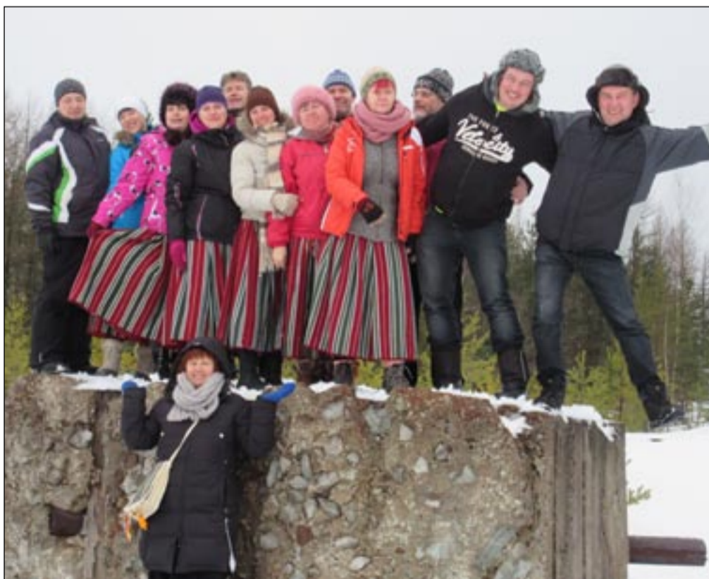
7. veebruaril osales Osula segatantsurühm Kohtla-Nõmmel Ida-Virumaa tuhamägede tantsupeol. Tuhamägede tantsupidu peeti juba 11. korda, meie tantsijad on osalenud kahel peol.