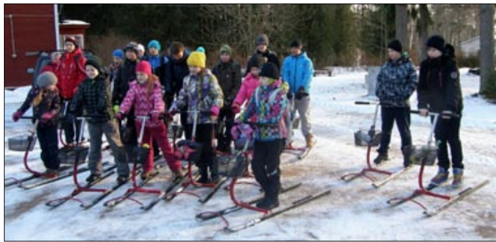
Osula kooli noorkotkad ja kodutütred tähistasid vastlapäeva tõukekelgumatkaga.

Ilm oli suurepärase, kelgud libisesid hästi, mat-