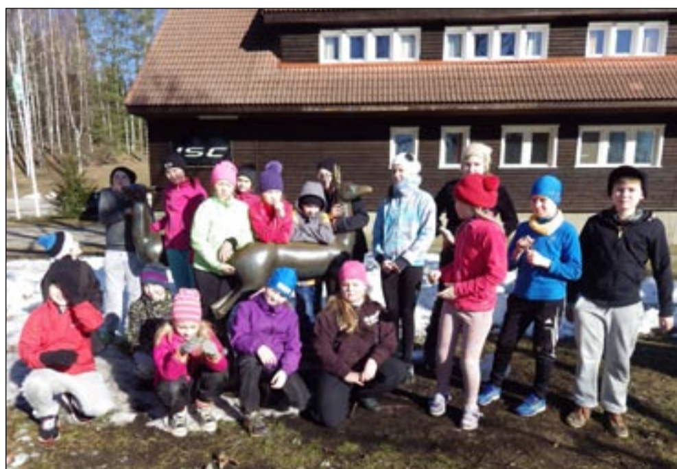
Sõmerpalu kooli õpilased Kurgjärvel laagris.