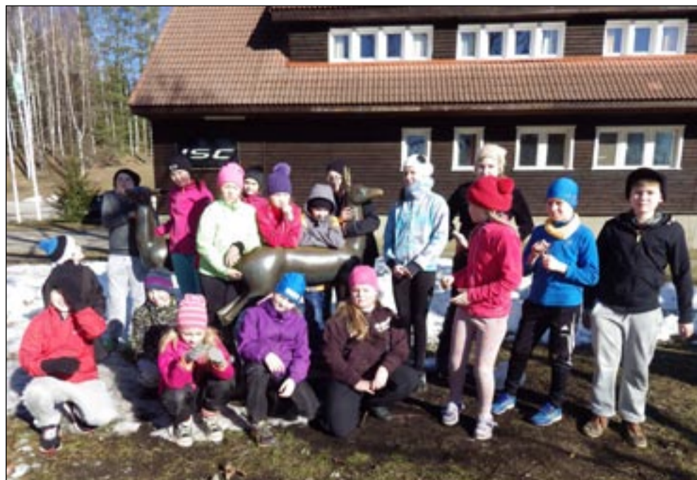
Sõmerpalu kooli õpilased Kurgjärvel laagris.