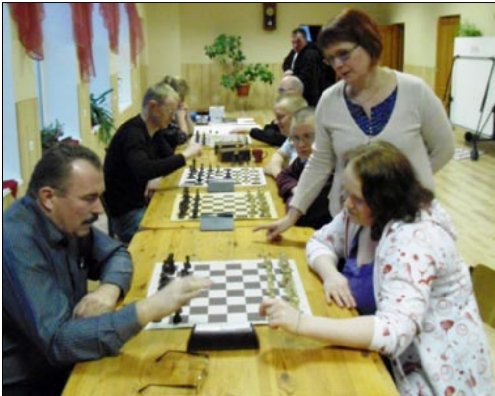
Malesõbrad teevad Sulbis pingsat mõttetööd.

Lisaks sellele ilmselgele tõsiasi- jale võib male õppimise puhul välja tuua veel mitu olulist ja