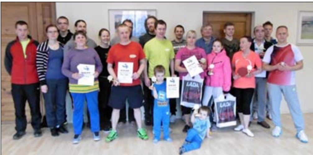
Sõmerpalu valla lauatenniseturniirist osavõtjad.