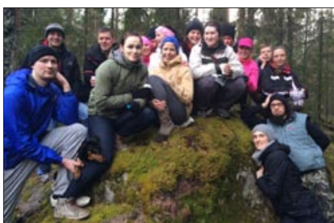
Matkaseltskond Tinnipalu rändrahn juures.