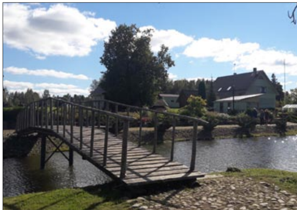
Perekond Veedleri kodu Liiva külas.

Perekond Veedleri kodu Liiva külas paistab mööda-