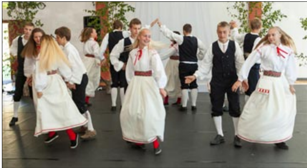
Osula kooli 9. klassi rahvatantsurühm Osula rahvatantsu 70. aastapäeva peol.