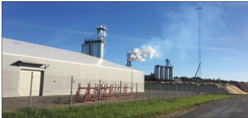
Osula Graanuli tootmishoone Varesel.

Sõmerpalu vallas tegut- sevad tootmisettevõtted,