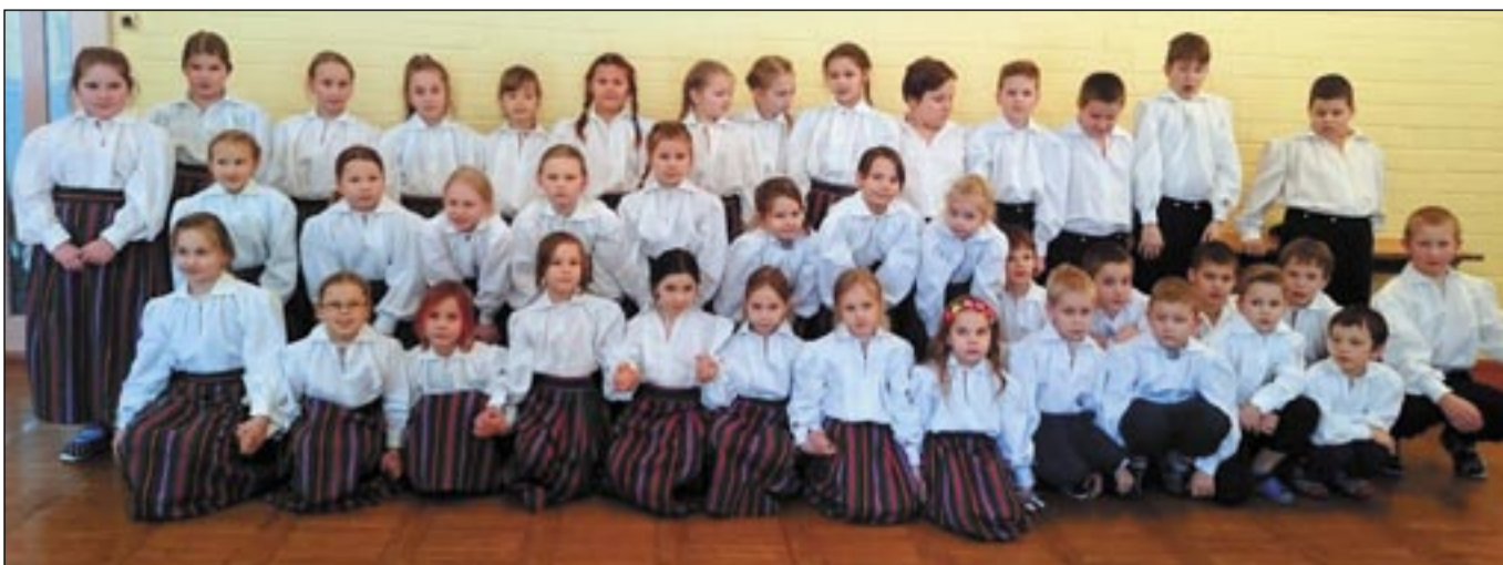
Osula kooli mudilaskoor uutes stiliseeritud rahvarõivastes.

Projekt «Osula põhikooli mudilaskoorile Urvaste kihelkonna rahvariide soetamine» sai teoks