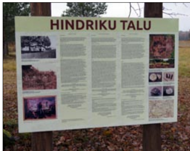
Määritsa lahingu infotahvel.