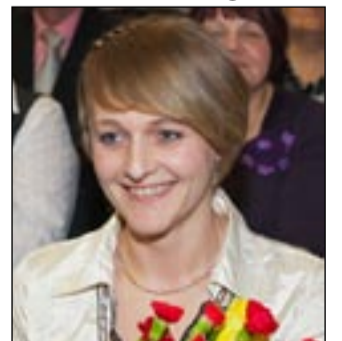
Maidu Jaasoni fotod