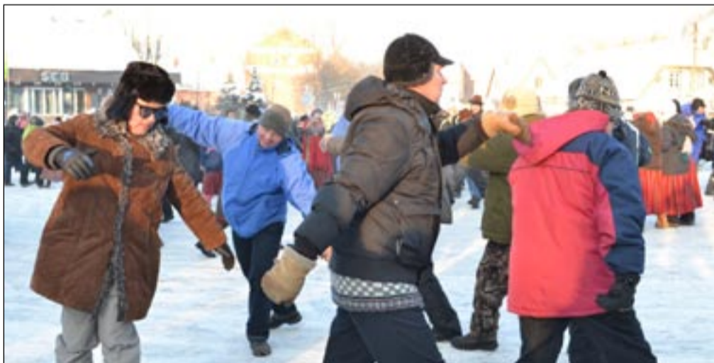
Mehed tantsivad karutantsu.