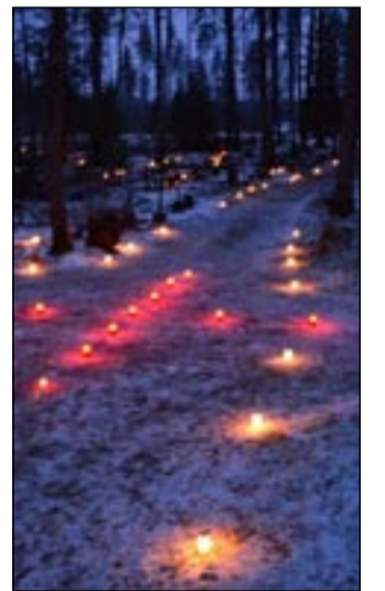
182 annetatud küünalt valgustasid terve Osula kalmistu.

Suur tänu kõigile, kes ettevõtmist toetasid – vaatepilt oli seda väärt.