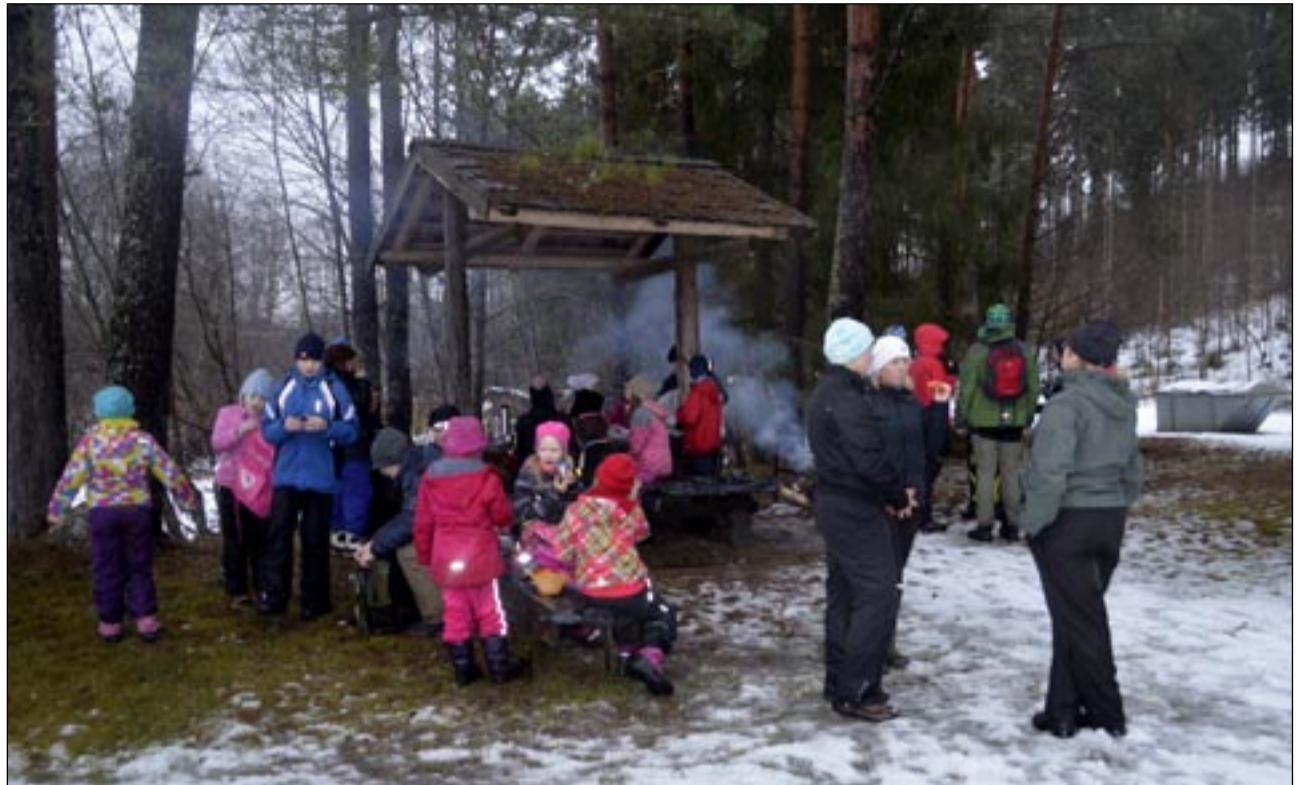
Matkajad on jõudnud Harjumäele.