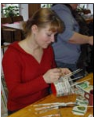
Nii käis ajalehtedest vaagna punumine.