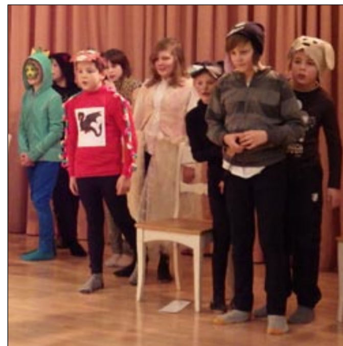
Sõmerpalu kooli õpilased karnevalil võistlushoos.

Mängisime ka ringmänge ja lõpuks tantsisime. Oli väga vahva karneval.