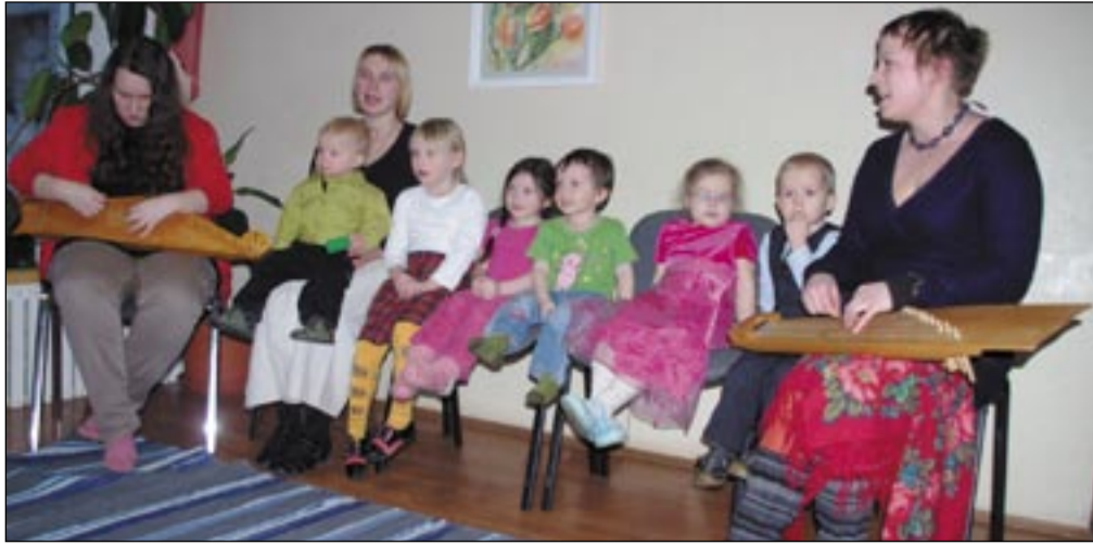
Kärgula pärimusmuusikud emakeelepäeval Sulbis esinemas.

Osalejad said tutvuda võrukeelsete trükistega ning nautida Kärgula