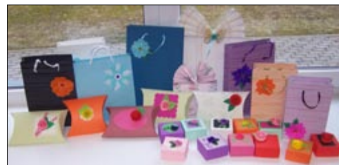
Õpitoas meisterdatud kingikotid ja karbid.