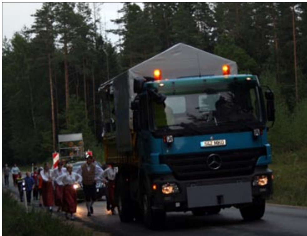
Suve üheks eriliseks ettevõtmiseks oli teatetants 23. augusti õhtul.