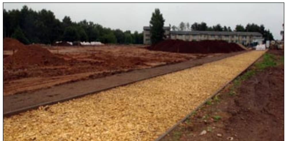
Koostöös Osula külaseltsiga on valmimas Osula staadion, ehitus läheb maksma 160 000 eurot.