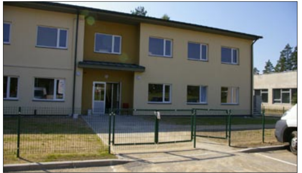
Sõmerpalu vallas on viimastel aastatel tehtud mitmesuguseid suuri ehitustöid. Viimati, 2009. aasta sügisel valmis hooldekodu, mille ehituseks kulus 640 000 eurot.