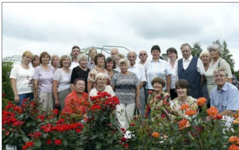
Segakoori lauljad Põltsamaa Roosiaias.

palju ilu! Sai osta roosiistikuid või ka lihtsalt jalu-