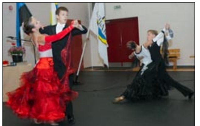
Võistlustantsijate värvikas etteaste.