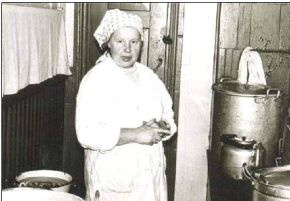
Heljula Plangi Sõmerpalu kooli sööklas 1970. aastatel.

Alles siis sai minna metsavahtide juurde, kes näitasid, milliseid puud võis koolile lõigata.