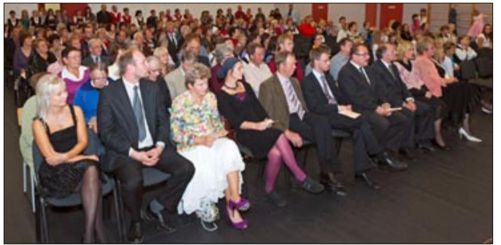
Valla sünnipäevapidu Osula kooli saalis.