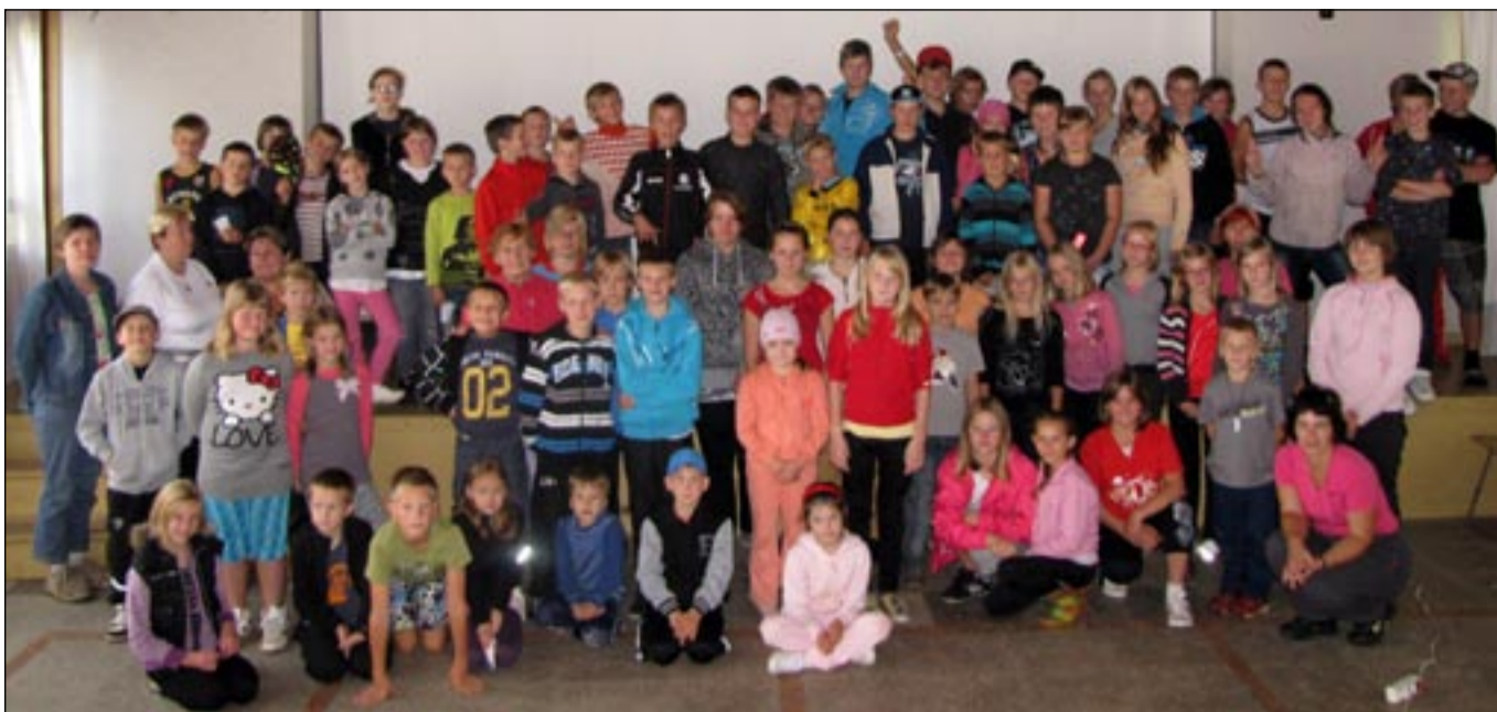
Sõmerpalu koolipere looduslaagris.

Pärast kõhukinnitust ja väikest puhkust sõitsime jälle kahes grupis matka-