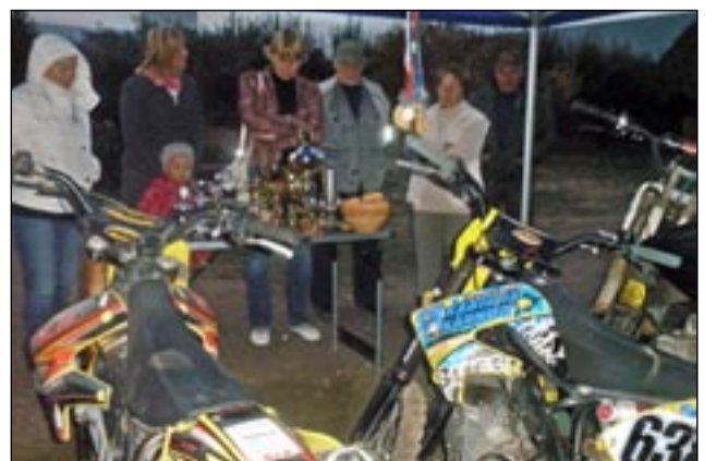
Ekskursioonil Tuti talus tsikleid uudistamas.