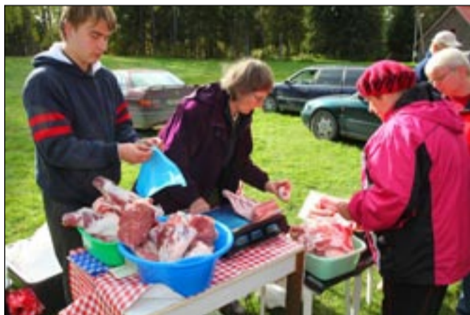
Lambaliha müük läks hästi.