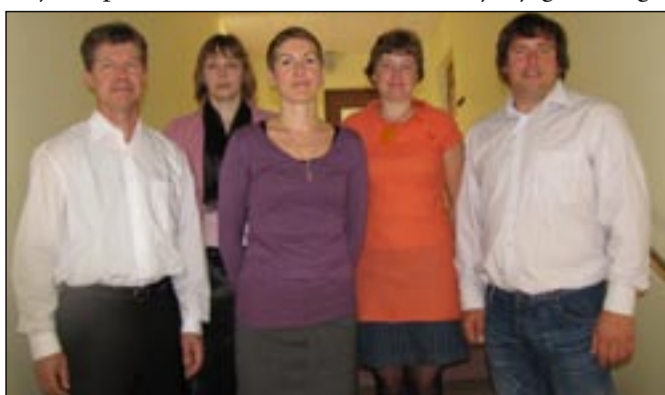
Lastevanematest tugiõpetajad õpetajate päeval Sõmer- palu põhikoolis.

õpetajatest lastevanemad õpilaspere 9. klassi õpilaste juhendusel kahte rühma.