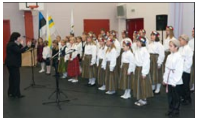
Koolilapsed valla sünnipäevaaktusel laulmas.