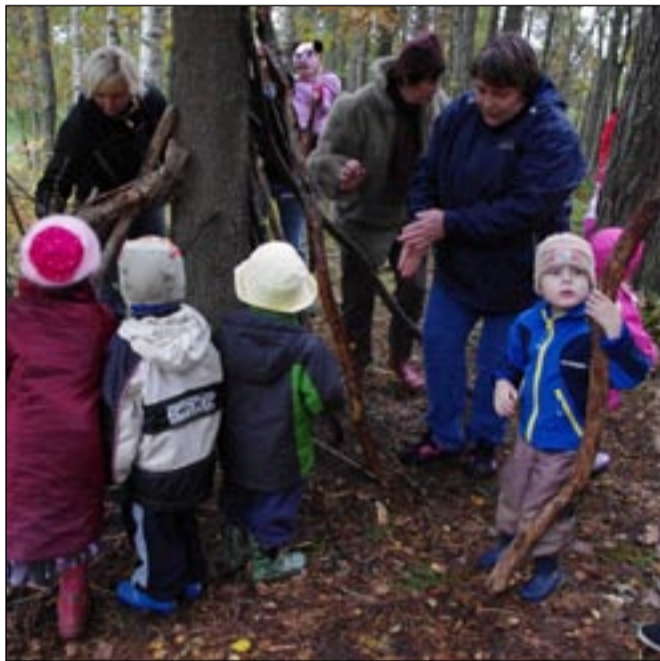
Lapsed metsaõnni tegemist õppimas.