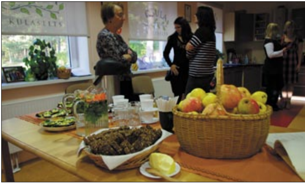
Osula külaseltsi sünnipäevapidu eelmisel aastal.