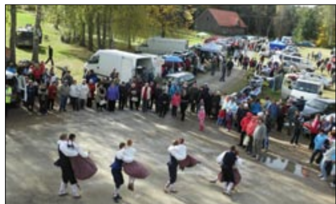
Sulbi Mihklilaat oli hoogne ja rahvarohke.