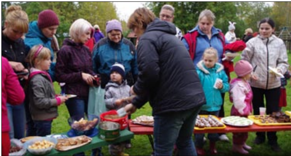
Vanemad olid küpsetanud heategevusliku kohviku jaoks palju maitsvat kraami.

Tänane keskkonnaameti toreda õppeprogrammi eest!