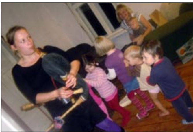
Pärimusringi lapsed tantsivad sabatantsu.