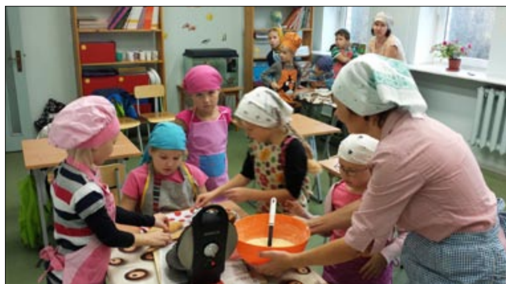
Osula kooli algklassiõpilased vahvlipõõ jaoks vahvleid küpsetamas.