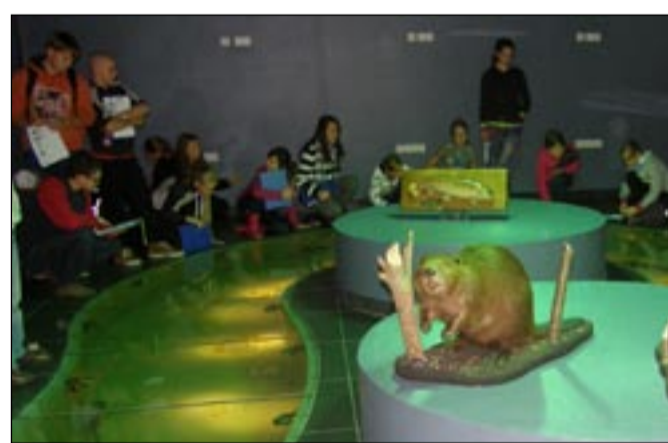
Osula kooli õpilased kalu uudistamas.

Lõunasöögiks pakuti hakklihasuppi ja saiavormi. Kui lõuna oli söödud, mindi orienteeruma. Selleks jagati õpilased nelja-viieliikmelisteks rühmadeks ning neil tuli GPSi kasutades täita ristsõna, mille küsimused olid seotud Võrtsjärve ja Eesti loodusega.