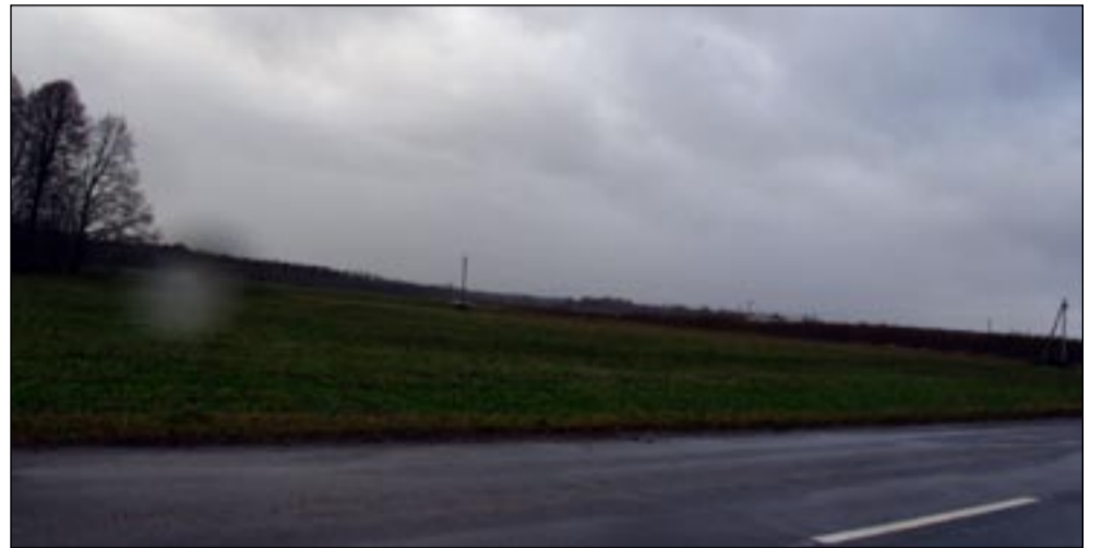
Suur puidugraanuleid tootev tehas ehitatakse Toftani ja metsatuka vahelisele maatükile.