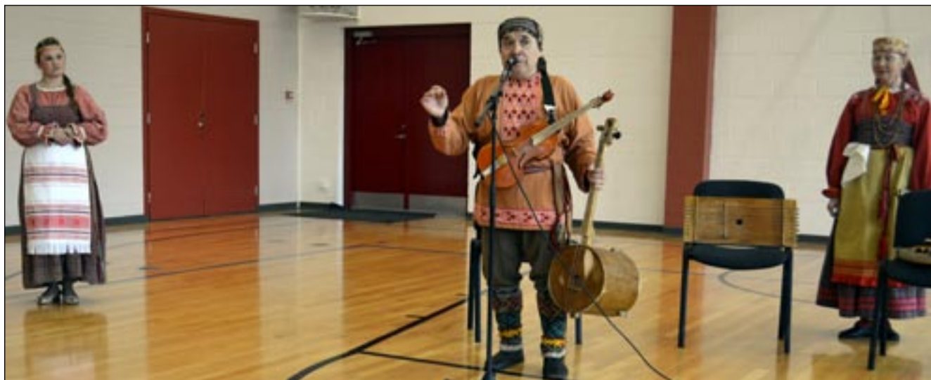
Komid Osula kooli spordisaalis esinemas.