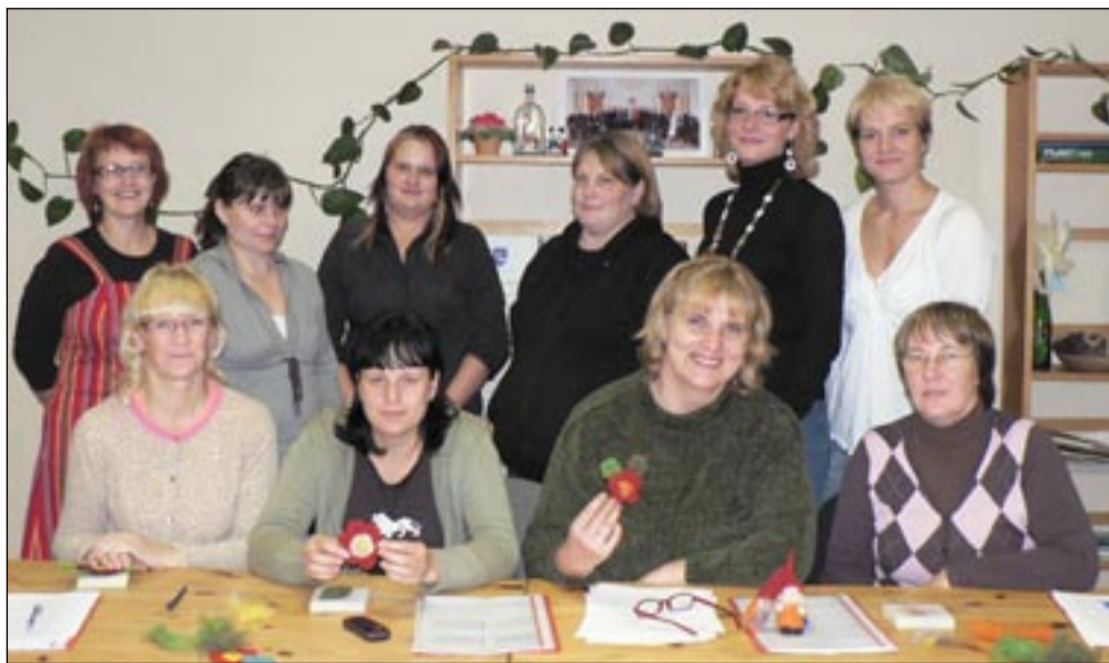
Töötud lastevanemad saavad üksteiselt tuge ja jõudu töö otsimiseks.

Sõmerpalu, Osula, Kärgula ja Kahro külast. Projekt ongi mõeldud tervele valale.