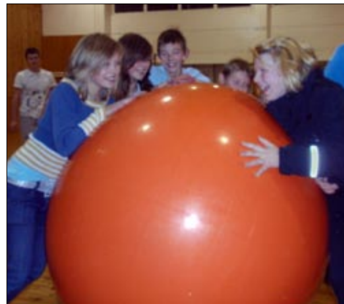
Üks meie valla noortele korraldatud üritus oli pushpallivõistlus Sõmerpalus.

Rahulikku jõuluaega ja ilusat uut aastat kõigile!