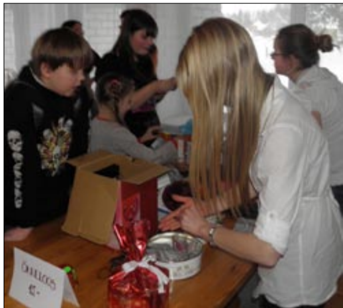
Jõululoterii tulu kulub kooli huvitegevusele.