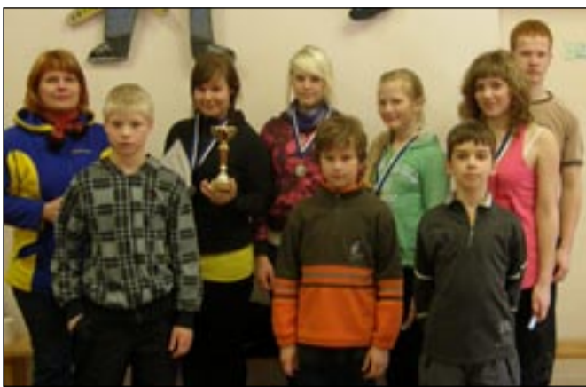
Kodutütred ja noorkotkad maakondlikul oskuste võistlustel.

Need erialamärgid teenisid nad välja, esindades mul-