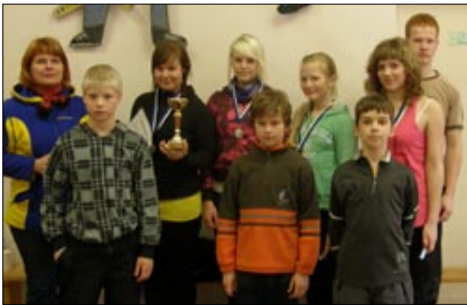
Kodutütred ja noorkotkad maakondlikul oskuste võistlustel.

Need erialamärgid teenisid nad välja, esindades mul-