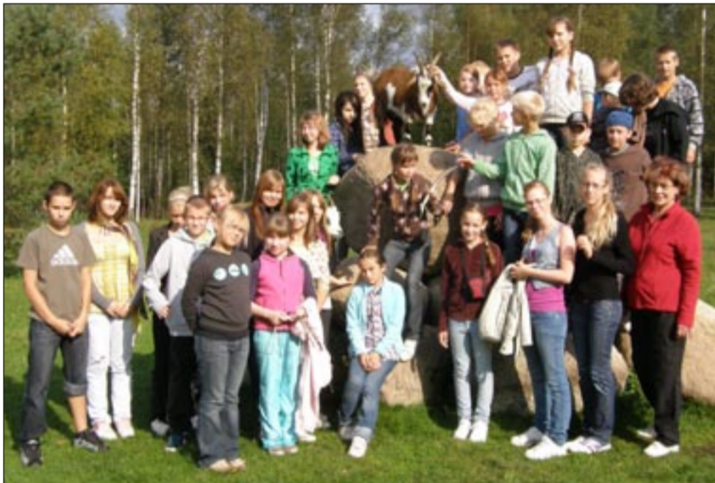
Osula kooli paremad õppurid mullu preemiareisil Pärnumaal.

Võru lähedal Sõmerpalu vallas asuvad 119 õpilasega Osula põhikooli võib julgesti nimetada elujõuliseks maakooliks. Tublid spordilapsed, head tulemused olümpiaadidel, moodne võimla ja käsitööklassid, aga ka 19 tublit õpetajat ja laste käekäigule kaasa elav direktor.