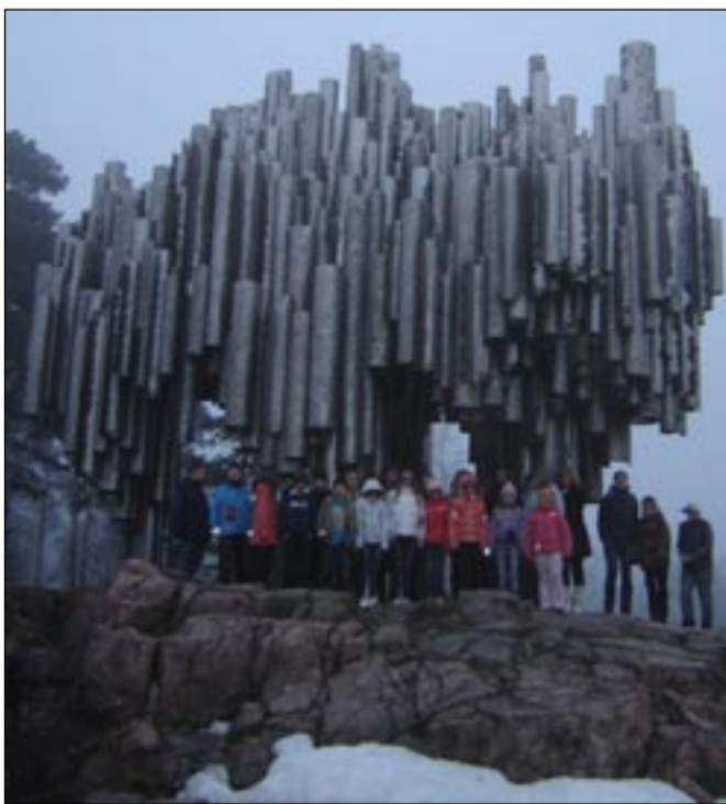
Sibeliuse mälestusmärgi juures.

Seejärel sõitsime Tikkurilasse, kus külastasime Heureka teaduskeskust ja planetaariumi.