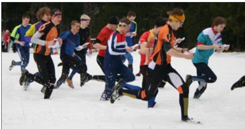
Orienteerujad pidid tänavu tegema ühisstardi lumes.

Karjalaskevõistlusel jäid kaardi ja maastikuga rahule nii 7–8aastased põnnid kui ka Eesti koondise liikmed ja veteranid. Vanimad võistlejad olid üle 70aastased mehed ja naised.