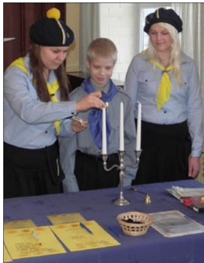
Koondusel võeti vastu uusi noorkotkaid-kodutütred.

soki sees oleva augu ära parandama, ravimtaimi ja kuivaineid tundma, vildist eluks vajaliku eseme tegema.