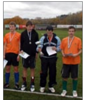
Osula põhikooli jalgpallivõistkond saavutas rahvaliiga meistrivõistlustel teise koha.