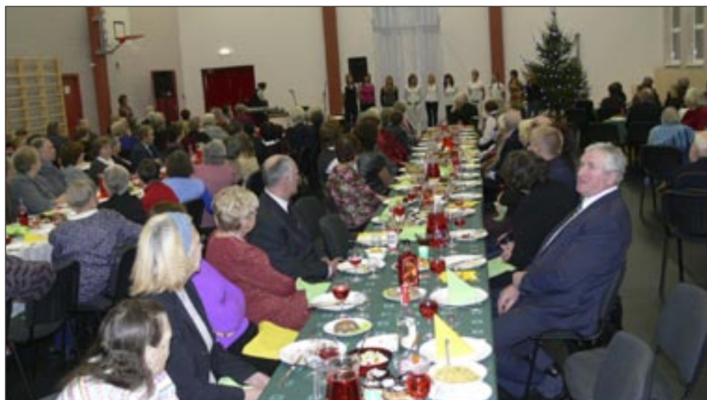
Pensionäride jõulupidu möödunud laupäeval Osula põhikooli võimlas. Söödi jõulu- praadi, meelelahutust pakkusid taitlejad ja tantsuks mängis ansambel HAAG.