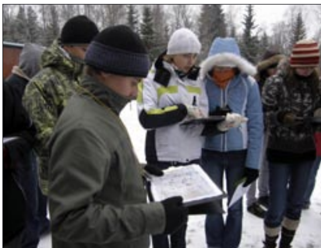
Õpilased Vällamäe maastiku kaarti uurimas.

Jalgade all olev lumi tegi iseloomulikku häält ja pakkus kõigile huvi – talv