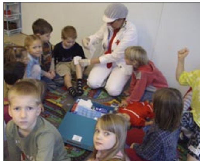
Doktor Ai-Ai tutvustas lastele lihtsamaid esmaabivõtteid.

Lasteaiapere ja tublide lastevanemate abiga löime edukalt kaasa ka üleriigilises prügi koristusprojektis «Teeme ära!». Tegime puhtaks lasteaiade ümbruse, pargitee ja aiaguse rägastiku. Ka nõlvak sai valla tööliste abiga vanadest kuivanud ja pehkinud puudest puhtaks. Nüüd on lastel suurepärase võimalus seal allikavulinat ja linnulaulu kuulata.