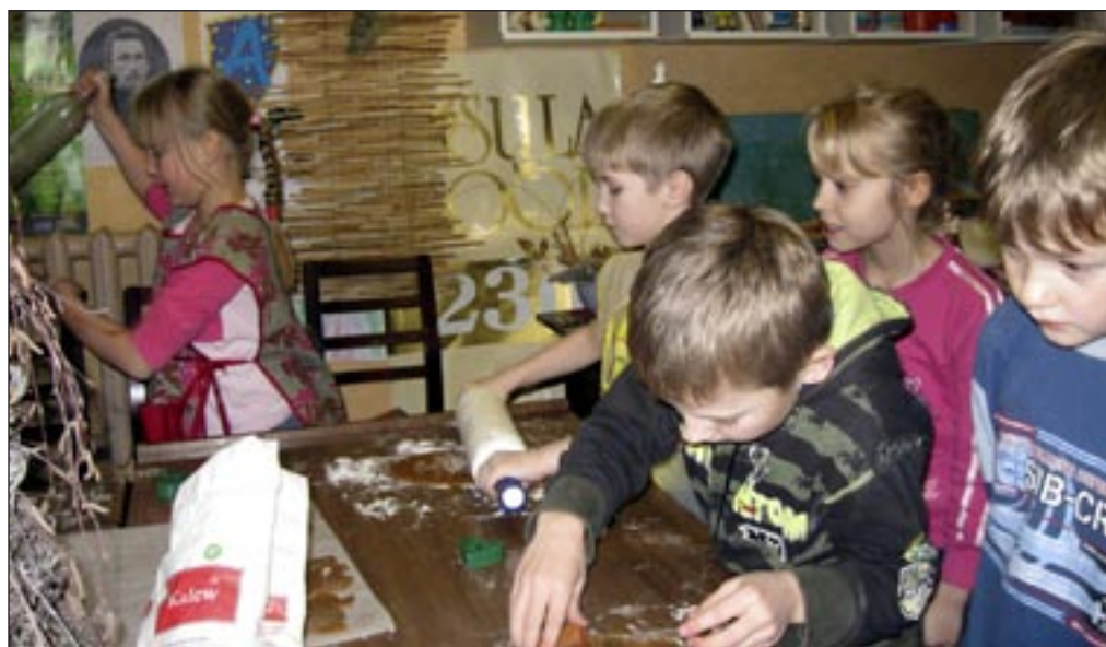
Osula kooli algklasside kunstiringi lapsed küpsetasid jõulukuul ühiselt piparkooke.