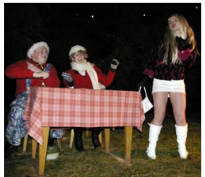
Osula kooli noored mängisid adventiaja alguse puhul lustakat näitemängu «Jõuluvana otsib assistenti».

Jõuluangel ja Jõulumemm soovisid kõigile kaunist jõulurahu ning süütasid soojust ja valgust andva küünla.