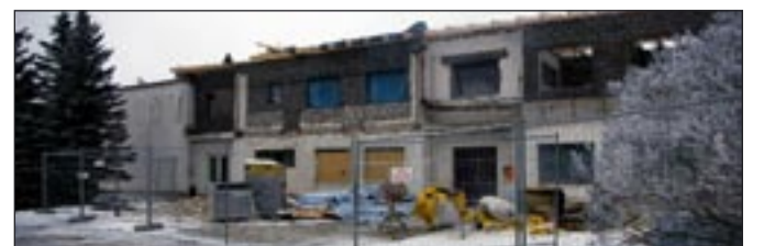
Vanast vallamajast saab 40 eakale mõeldud hooldekodu.

nipäraselt, saab 2010. aasta alguses ümberehitustööd alustada. Nii pääseb lasteae ruumikitsikusest. Rühmade arv lasteaias jääb samaks.