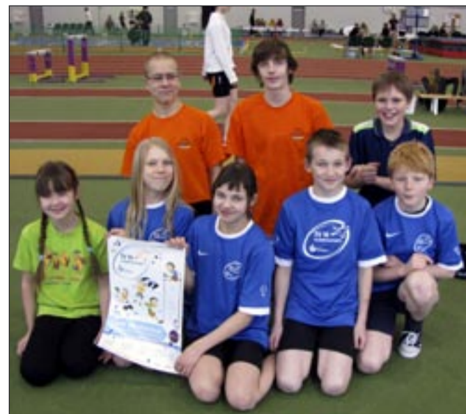
Osula kooli õpilased 10. Olümpiastardi võistlusel.

Et Osula kool konkurents- is püsiks, tuleks osale- da kõikidel etappidel. Sel- leks vajavad lapsed kooli ja vanemate toetust. Põidlad pihku!