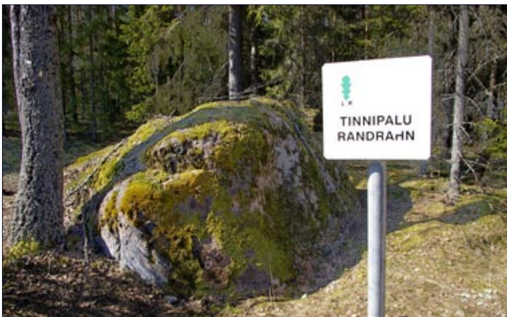
Ka pärimustega seotud kivid on pärandkultuuriobjektid.

Pärandkultuuriobjektid ei ole kaitse all, ka ei ole neid plaanis tulevikus kaitse alla võtta – nende kul-