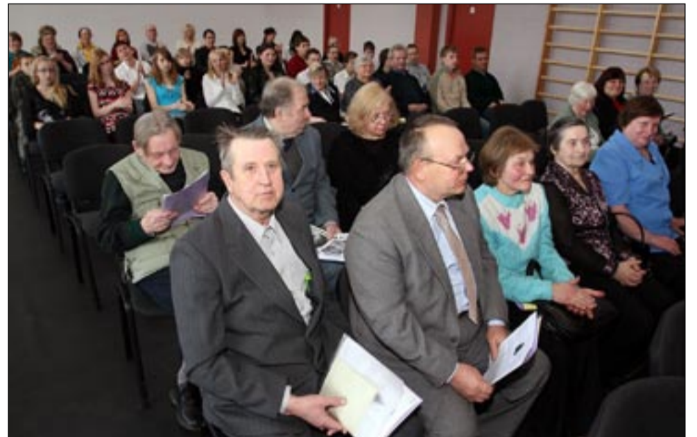
Osula kooli vilistlased kooli sünnipäevapeol.