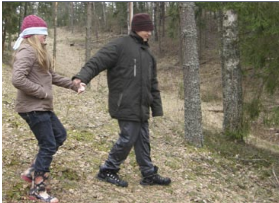
«Pimesikk» juhatati ühe puu juurde, et ta seda kompides-nuusutades tundma õpiks.

See ülesanne meeldis lastele ja üllatus oli suur, kui koti avasime ja seal sees olnud esemed üle vaatasime. Kotis olid männi-