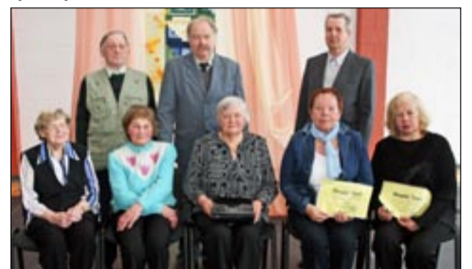
Osula kooli kuldend.

Suure huviga uudistas hõbelend oma kooliajal tehtud joonistusi, mis