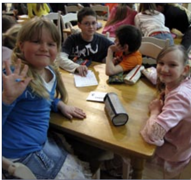
Sõmerpalu kooli algklassilapsed ainenädalal.

ERKI REMMELKOOR Lõuna-Eesti päästeteenistuse ennetustöö büroo juhataja