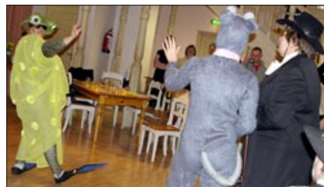
Konna kosjad «Sõmerpalu palukate» lustlikus esituses.

Vokaalansambleid esindas Sõmerpalu Palukad, kelle laulud ja humoorikas lähenemine vabalt valitud